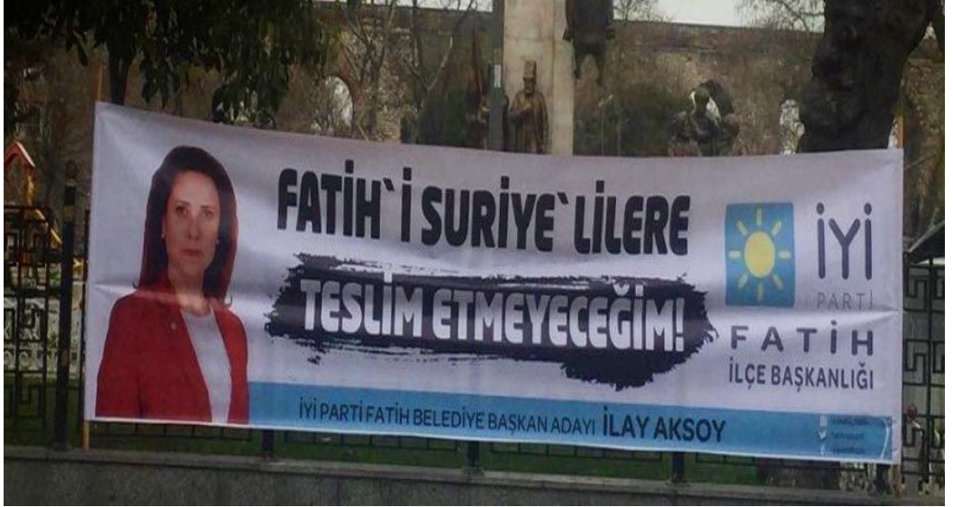
Şekil 1. Fatih’te seçim kampanyası pankartı

Göçün ve göçmenlerin toplumun algısında bir sorun ve tehdit unsuru olarak yer almasının çok boyutlu sebepleri olmakla birlikte, yoğunluğu büyük kentlerde yaşayan mültecilere ve göçmenlere atfedilen sorunlar, kente dair sorunlarla iç içe geçmekte ve yerel politikanın başlıca aktörü olan belediyeleri de bu alanda bir politika üretmeye itmektedir. Öyle ki, geçtiğimiz genel ve yerel seçimlerde siyasi adaylara “mülteci sorunuyla” ilgili görüşleri ve planları sıkça sorulmuş ve bu soruna yönelik çözüm önerileri seçim kampanyalarının önemli bir bölümünü oluşturmuştur. Ancak seçim söylemlerinin ve kent politikalarının odağına kentin öznelere yerine “vatandaş” yani “seçmen” öznesini koyan bir siyasi anlayışla, “mülteci sorununa” getirilen çözümler de hak temelli olmaktan oldukça uzak ve popülist kalmaktadır. Örneğin, “Fatih’i Suriyelilere Teslim Etmeyeceğim!” sloganı, İstanbul’da geçici koruma statüsü altındaki Suriyeli mültecilerin yoğunlukla yaşadığı bir ilçe olan Fatih’te 2019 yılında belediye başkanı adaylarından birinin seçim kampanyasının ana fikrini yansıtan başlıca slogan olmuştur.